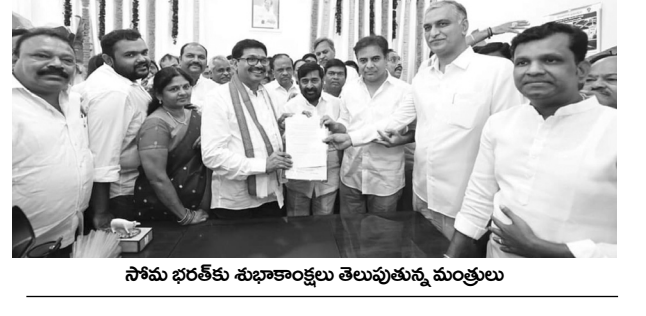
సోమ భరత్ కుశభాకర్లు తెలుపుతూ మంత్రులు